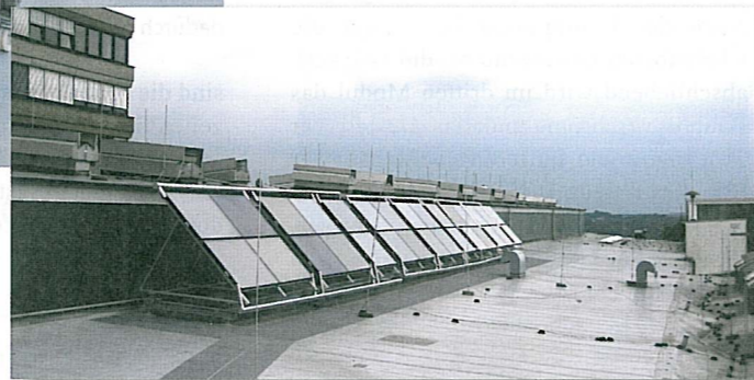
Die 30 Solarkollektoren auf dem Dach des Remscheider Firmensitzes unterstützen die Heißwasserbereitung

dazu die CKW/Kohlenwasserstoff-Reinigung getestet wurden. Folgende Kriterien waren im Lastenheft definiert: Es sollte ein Durchsatz von sechs bis zehn Chargen pro Stunde möglich sein, und die bisherige Standzeit der Reinigungsbäder sollte von bisher einer Woche auf mindestens sechs bis acht erhöht werden. Ein weiterer wesentlicher Punkt war die Erfüllung der Qualitätsanforderungen. Die Fittings sollten span-, öl- und fettfrei für die nachfolgenden Prozesse (zum Beispiel Montage, Lötten oder Versand) gemäß den definierten Qualitätsansprüchen werden.