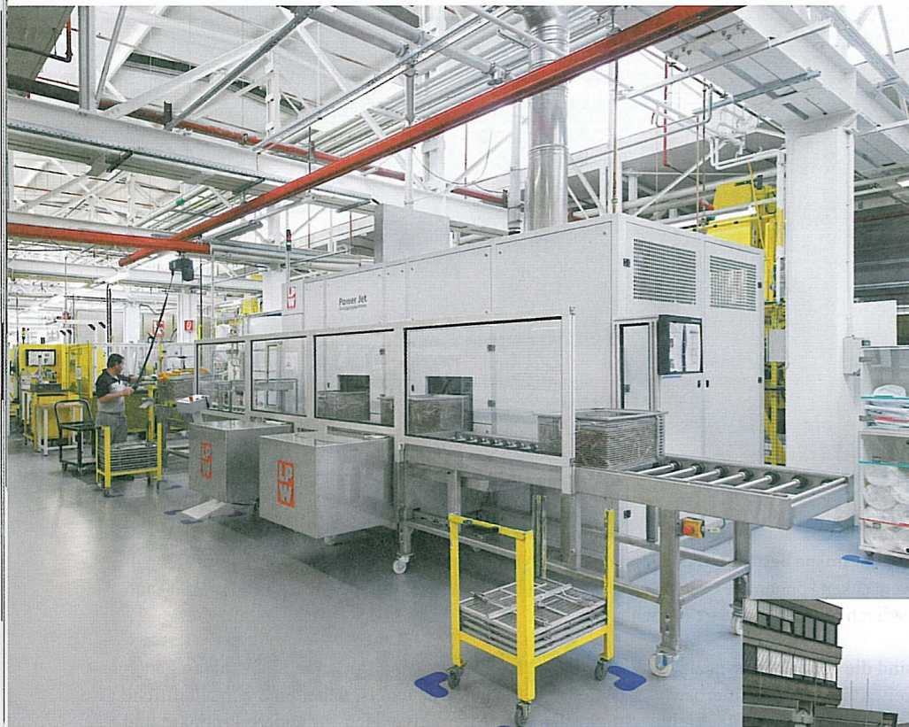
Die LPW PowerJet 670 Twin nimmt am Remscheider Produktionsstandort der Vaillant Group 16 Quadratmeter Platz ein

dazu die CKW/Kohlenwasserstoff-Reinigung getestet wurden. Folgende Kriterien waren im Lastenheft definiert: Es sollte ein Durchsatz von sechs bis zehn Chargen pro Stunde möglich sein, und die bisherige Standzeit der Reinigungsbäder sollte von bisher einer Woche auf mindestens sechs bis acht erhöht werden. Ein weiterer wesentlicher Punkt war die Erfüllung der Qualitätsanforderungen. Die Fittings sollten span-, öl- und fettfrei für die nachfolgenden Prozesse (zum Beispiel Montage, Lötten oder Versand) gemäß den definierten Qualitätsansprüchen werden.